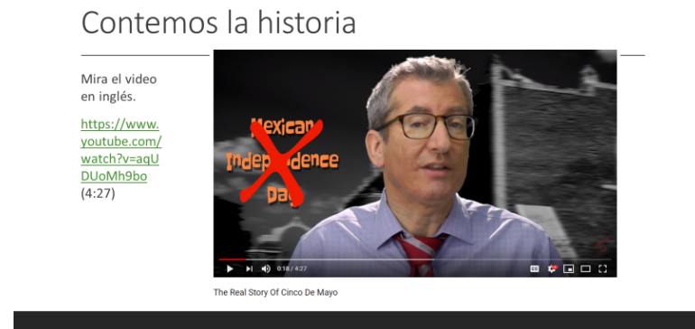
Image 2 is a screenshot of the factual video students will watch, along with the link.