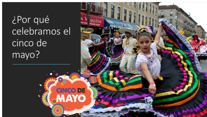
Image 1 is a picture of an outdoor celebration of cinco de mayo with the question ¿Por qué celebramos el cinco de mayo?